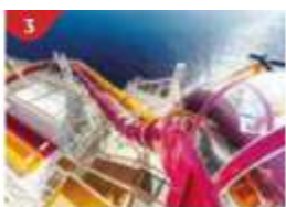
Waterslide Park Get drenched in fun on one of our six different waterslides.