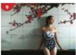
Crystal Life™ Spa Rejuvenate mind, body and soul with our holistic Western and Asian spa experience.