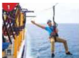
Ropes Course & Zipline Feel the thrill of gliding above the ocean on a 35-metre zipline.

ถ้าท่านประสงค์จะถือกระเป๋าเดินทางลงด้วยตัวเองไม่จำเป็นต้องวางไว้ที่หน้าห้องพัก