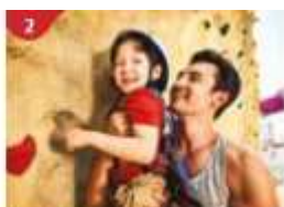
Rock Climbing Wall Challenge yourself on our mountainous rock climbing wall.