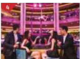
Bar 360 Catch live music and aerial acrobatic performances with a glass of champagne.