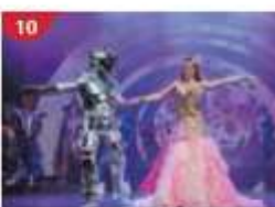
Zodiac Theatre Enjoy live production shows from the acclaimed award-winning entertainment team.

**เรือจะมีใบแจ้งสถานที่และเวลาที่ห้องพักของท่านเพื่อนให้ท่านรับหนังสือเดินทางคืน