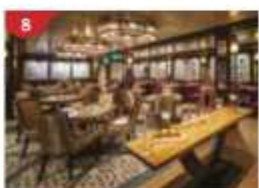
Bistro By Mark Best Relish contemporary Western cuisine from the internationally-acclaimed Australian chef.