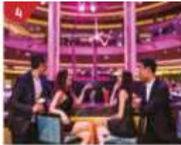
4 Bar 360 Catch live music and aerial acrobatic performances with a glass of champagne.