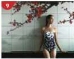
9 Crystal Life™ Spa Rejuvenate mind, body and soul with our holistic Western and Asian spa experience.