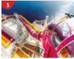
3 Waterslide Park Get drenched in fun on one of our six different waterslides.