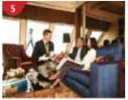
5 The Palace Indulge in European-style butler service and exclusive facilities.