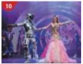
10 Zodiac Theatre Enjoy live production shows from the acclaimed award-winning entertainment team.