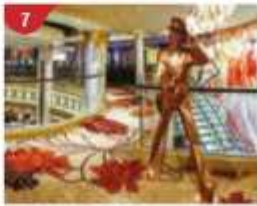
7 Johnnie Walker House™ Immerse yourself in the intricate world of premium Scotch whisky.