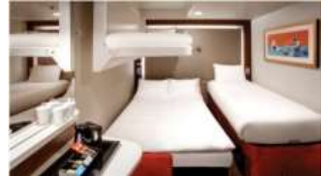
พัก 3-4 ท่าน