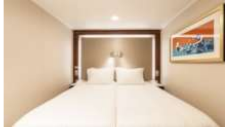
พัก 1-2 ท่าน

From 13 - 14 sq.m Max Occupancy 2-4 ^ Deck 5/8/9/10/11/12/13/15 2 Single Beds / 2 Single Beds + 1 Ceiling Pullman Bed / 1 Single Bed + 1 Pullman Bed + 1 Double Sofa Bed