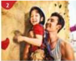
2 Rock Climbing Wall Challenge yourself on our mountainous rock climbing wall.