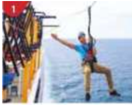
1 Ropes Course & Zipline Feel the thrill of gliding above the ocean on a 35-metre zipline.