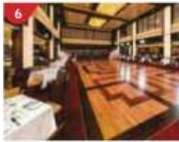
6 Dream Dining Room Savour a wide variety of Asian and international cuisine.