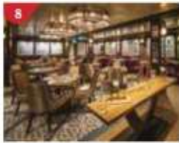
8 Bistro By Mark Best Relish contemporary Western cuisine from the internationally-acclaimed Australian chef.