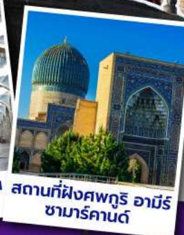
สถานที่ฝังศพกูรี อามิร ซามาร์คานด์