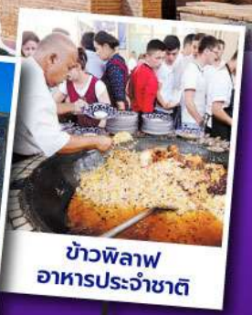
ข้าวพิลอฟ อาหารประจำชาติ