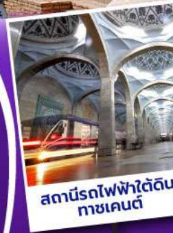
สถานีรถไฟฟ้ายุคใหม่ ทาชเคนต์